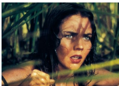
D.R. DUEL AU SOLEIL