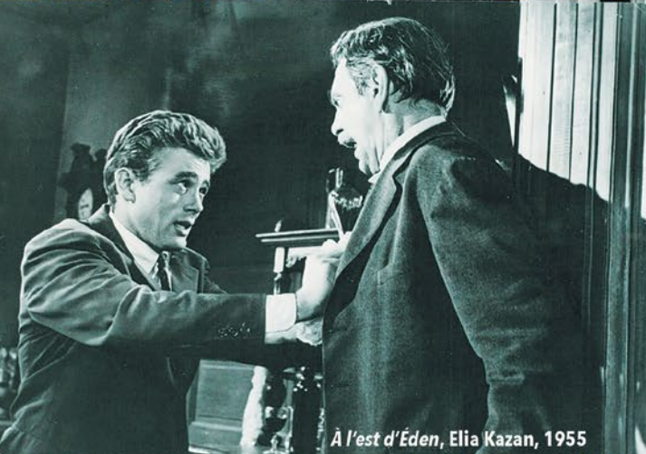
À l'est d'Éden, Elia Kazan, 1955