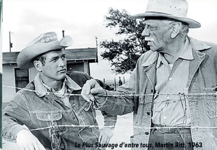
Le Plus Sauvage d'entre tous, Martin Ritt, 1963