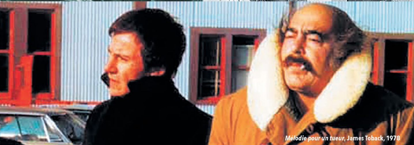
Mélo die pour un tueur, James Toback, 1978