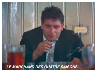
LE MARCHAND DES QUATRE SAISONS