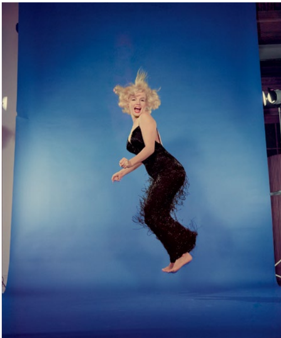
Philippe Halsman - Marilyn Monroe, 1959 - Musée de l'Élysée © 2015 Philippe Halsman Archive / Magnum Photos.