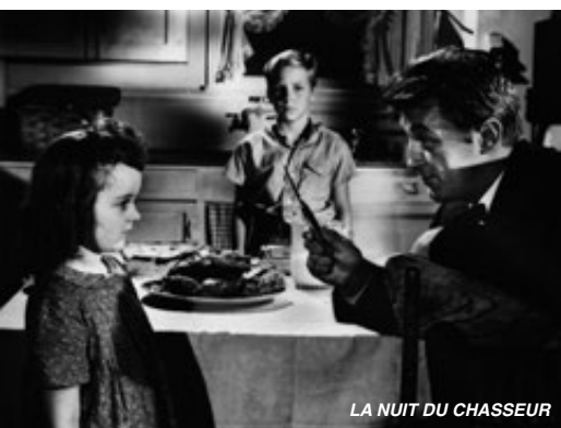
LA NUIT DU CHASSEUR