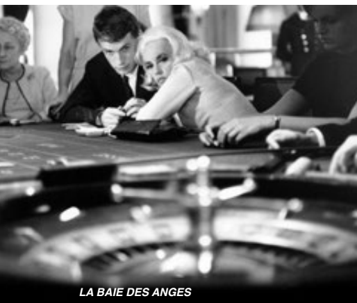
LA BAIE DES ANGES