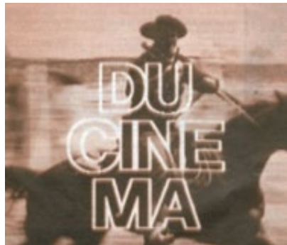
HISTOIRE(S) DU CINÉMA, © JEAN-LUC GODARD, GALLIMARD, GAUMONT.

TRAFIC n°50, Qu'est-ce que le cinéma ? © P.O.L., 2004