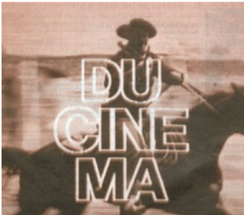
HISTOIRE(S) DU CINÉMA, © GODARD, GALLIMARD, GAUMONT.

Peut-être ceci : les trésors jusqu'à présent déballés par le fabuleux navire lui ont donné sa forme, son allure, son style. Bien sûr les œuvres comptent par elles-mêmes et avant tout, mais leur assemblage a donné son corps et sa lumière à une idée, celle de l'addiction, dont nous n'imaginions pas à quel point elle s'incarnerait dans notre temps. La lente dissémination flottante de ces œuvres, leur agrégation parfois