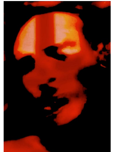
La Nuit Épuisée