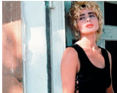
SAILOR ET LULA

La mère de Lula devient folle de voir sa fille partir en cavale avec Sailor lors de sa permission de sortie de prison. Elle finit par engager des tueurs... Sailor et Lula est adapté d'un roman de Barry Gifford que David Lynch enrichit de son univers pour en faire un road-movie très rock'n'roll, doté d'un certain lyrisme, imprégné de fantastique (et de références au Magicien d'Oz). Le cinéaste sait créer des images fortes, parfois cauchemardesques, frôlant la démesure.