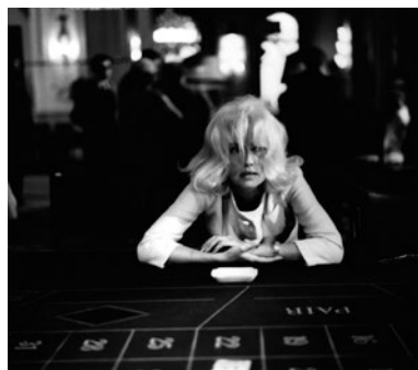
LA BAIE DES ANGES