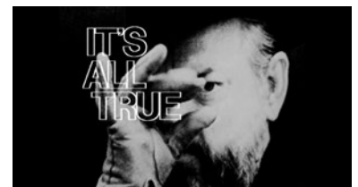
HISTOIRE(S) DU CINÉMA, © GODARD, GALLIMARD, GAUMONT

ou une Porsche Cayenne devraient-ils être à nos yeux plus surprenants, je veux dire à ce degré d'onctuosité des surgissements, des matériaux qui s'en écoulent en terme de dynamique des fluides dont sont faites nos plus élégantes métaphores, à nous faire éprouver un degré de flexibilité reconductible en tous domaines. La preuve !