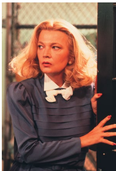
D.R. LOVE STREAMS