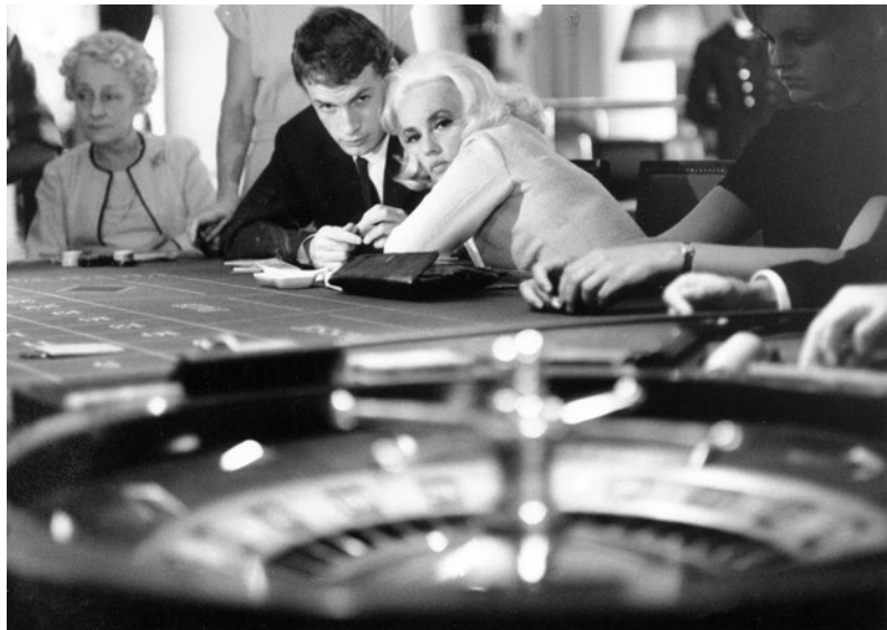
LA BAIE DES ANGES