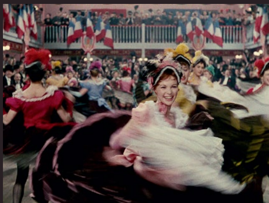
French-cancan , un film de Jean Renoir.