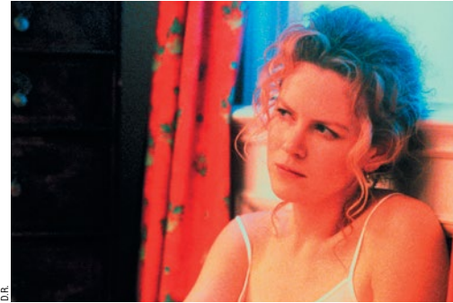
D.R. EYES WIDE SHUT

Avec sa femme Alice, ils se rendent à la fastueuse réception d'un de ses clients.