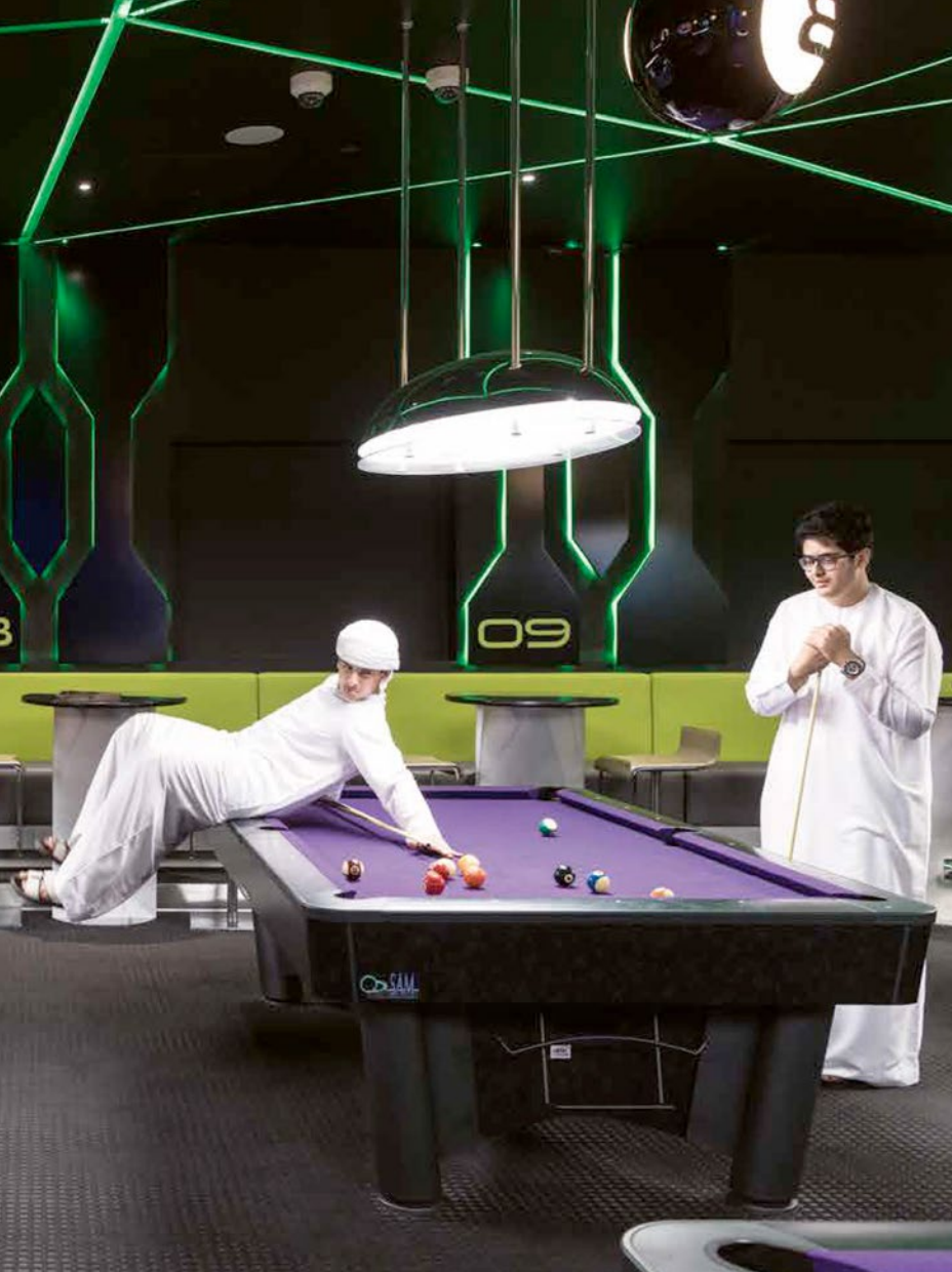
Garden of Delight