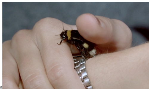
THE DEVIL IN THE DETAILS

Sur une composition musicale de Steve Reich, Found Footage (images trouvées) à partir de 100 films d'horreur, l'œuvre capture les langages des « mains » indépendamment de leur contexte d'origine.