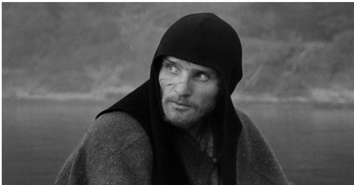
ANDREÏ ROUBLEV, ANDREÏ TARKOVSKI, 1966