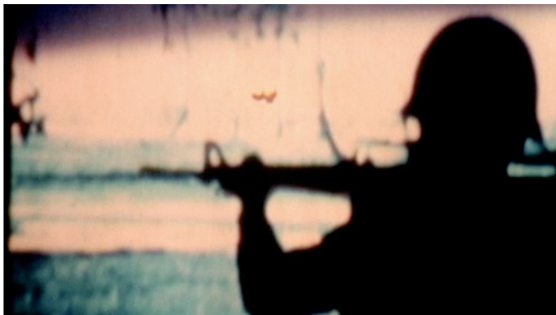
O SUPERMAN, ANGE LECCIA/PEREZ, 2020.

par Jérôme Farigoule, Conservateur du patrimoine, en dialogue avec Annick Le Marrec.