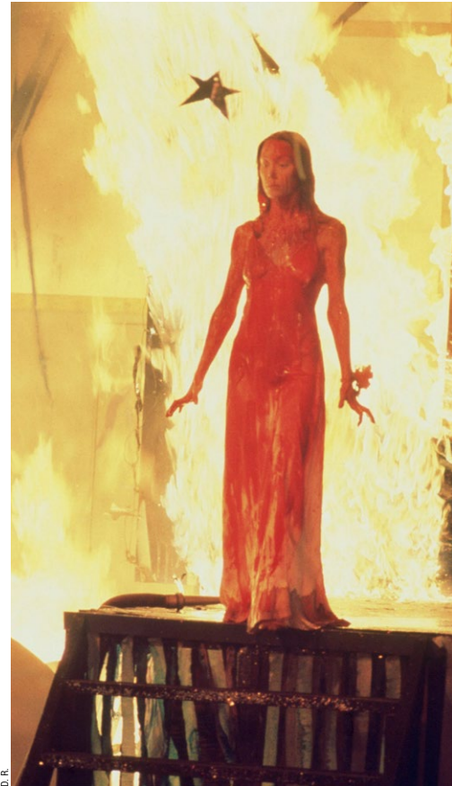
CARRIE, BRIAN DE PALMA, 1976

Arte Mare invite dfilms au cinéma Le Régent à Bastia à présenter La Ricotta , un tableau vivant de Pier Paolo Pasolini.